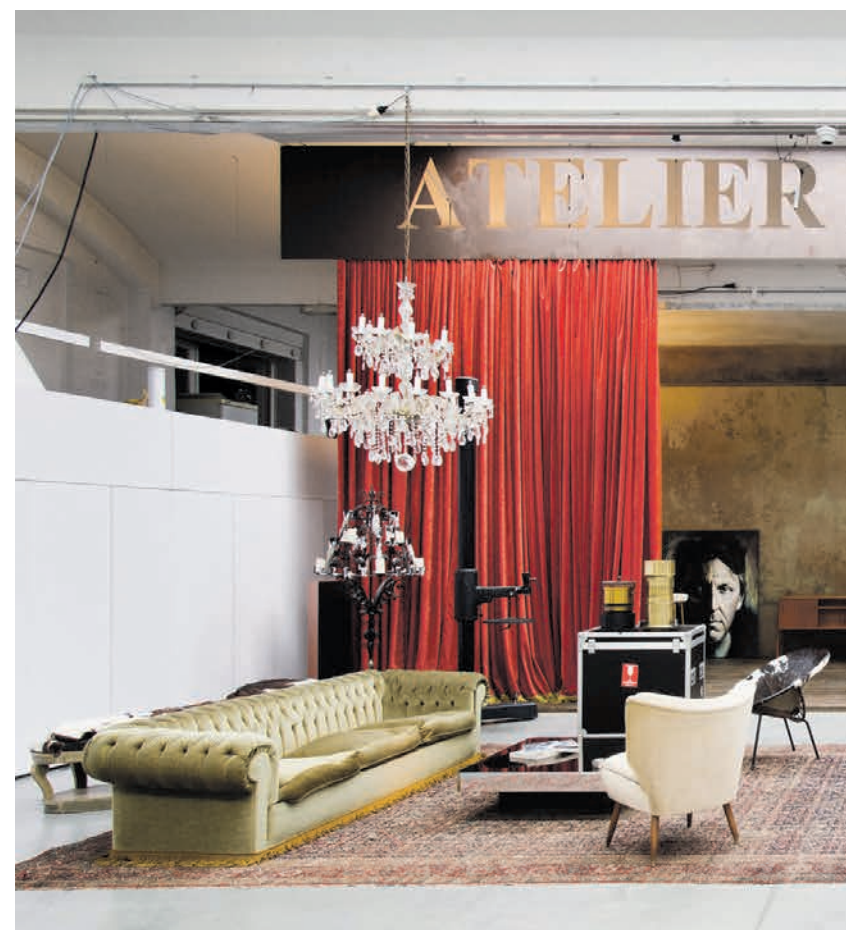
Een verbouwde loods met theatrale allures vormt de speeltuin van de