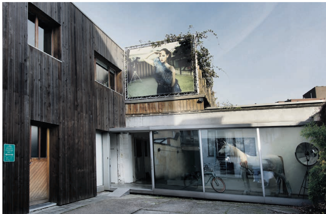
Een paard in de gang, een paneelgrote foto aan de gevel: saai oogt de woning van Marc Lagrange en Saskia Dekkers allerminst.

Cool zette in op een grote inloopdouché in natuursteen. Die sluit aan bij een kamerhoog raam dat uitgeeft op het (volledig van nieuwsgierige blikken afgeschermd) terras. Zo lijkt het alsof je staat te douchen in een zee van ruimte. De warme tint van de natuursteen geeft de badkamer toch een intiem gevoel.